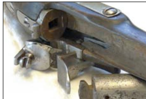
Eine Innovation - der aushakbare Lauf bei der Pistole m/1807

Nach einem Versuch von Helvig kam man in der Frage von Präzision und Wirkung zu dem Schluss, dass ein Karabiner mit glattem Lauf durch eine "Stutzenpistole" "welche mit einem Anschlagkolben versehen werden konnte und dadurch als Zweihandfeuerwaffe gebraucht werden konnte" übertroffen wurde. Jedoch bekam jeder Reiter nur eine mit gezogenem und außerdem eine mit glattem Lauf. Der dazugehörige Anschlagkolben sollte auf die Pistole aufgesetzt werden, welche dem Reiter am liebsten war. Der Eisenladestock war lose und sollte für beide Pistolen verwendet werden. Er war an der Patronentasche befestigt. Diese wurde als Kavalleriepistole m/1807 angenommen.