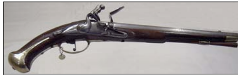
Pistole m/1738 " 1820

"Für den täglichen Dienst bei der Leibgarde zu Pferd" wurde die Pistole m/1738 "1820 eingeführt.